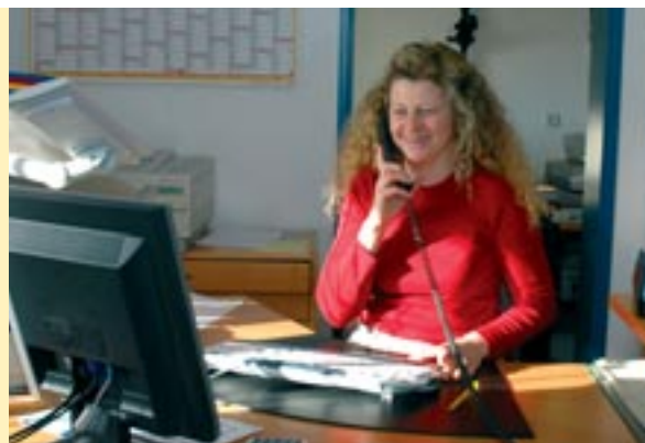
Telefonische Beratung und Verkauf

Als langjähriger Sea & Sea-Partner stehen wir Ihnen kompetent in Beratung, Verkauf und Service zur Seite.