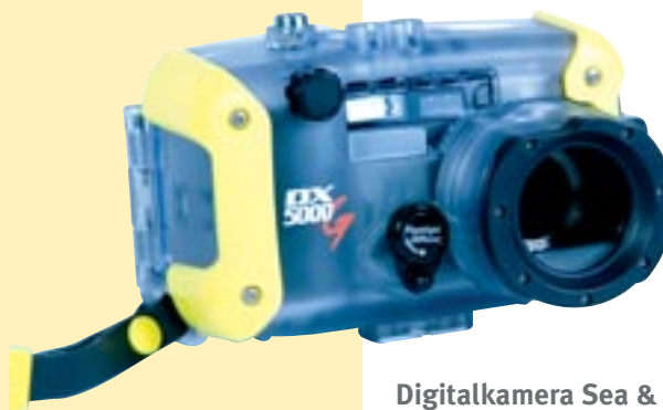
Digitalkamera Sea & Sea DX-5000G