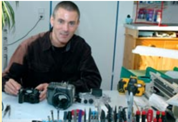
Service und Reparatur von Sea & Sea-Geräten