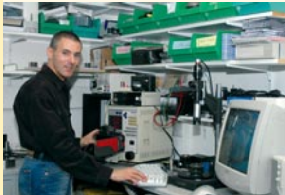
Technische Überprüfung am Kameratester und PC